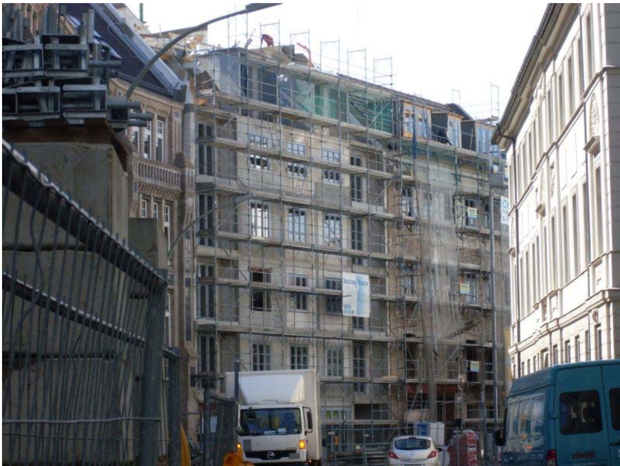
Das Musikerhaus am Spittelmarkt, Bautenstand Mai 2010

„Die wahre Ursache der baulichen Nachkriegsmisere ist diese fundamentale Geschichtslosigkeit des Zeitgeists.“, kann man den Frankfurter Architekten und Städteplaner Albert Speer zitieren. Er fügt hinzu: „Nur das Zusammenspiel von Alt und Neu ergibt Vielfalt. Zur Schönheit einer Stadt gehört, dass ihre Bauten verschiedene Epochen spiegeln. Diese Bauten müssen nicht immer besonders schön sein, sie müssen im Ausdruck für etwas stehen. Der Charakter einer Stadt wird stark von ihrer Geschichte geprägt, nicht nur von ihrer momentanen Funktion. Wer als Architekt darauf reagieren will, muss das Alte aber auch genau kennen. Die architektonische Vielfalt der deutschen Regionen, die in Jahrhunderten gewachsen ist, muss bewahrt und bei Neubauten berücksichtigt werden. Das ist lebenswichtig, wenn wir die gebaute Identität unseres Landes erhalten wollen.“ (Spiegelonline Interview vom 18.5.2010)